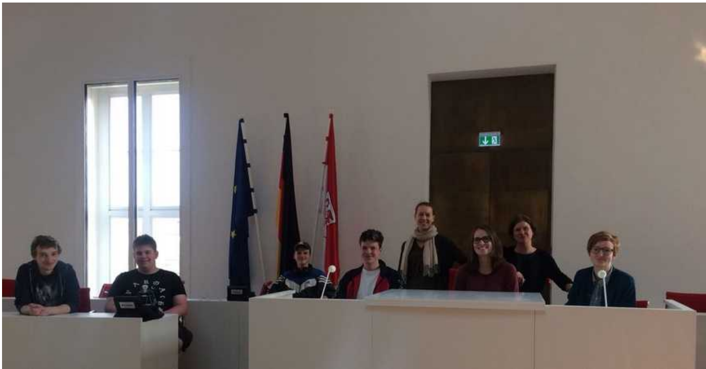
Der Vorstand der NAJU im Landtag Brandenburg